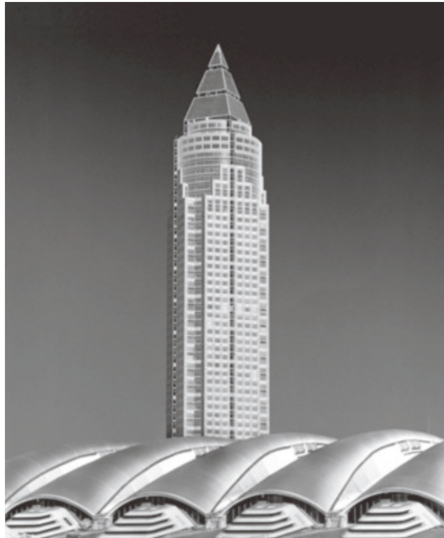
Durch ein Rotfilter wurde der komplementärfarbige blaue Himmel massiv abgedunkelt, während die Fassade des Messeturms, die aus rötlichem Granit besteht, deutlich aufgehellt wurde.

In der Schwarzweißfotografie sind Filter eine unentbehrliche Hilfe, um zu herausragenden Bildern zu gelangen. Sie können Tonwerte trennen oder harmonisieren, den Kontrast verstärken oder reduzieren. Sie können Dunst durchdringen oder ihn vertiefen, zu längeren Belichtungszeiten verhelfen, um Bewegungsunschärfen zu erzielen, offene Blenden zur Schärfentiefereduktion ermöglichen oder auch Reflexe unterdrücken.