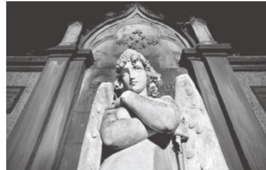
Durch die Kombination eines Rotfilters mit einem Polfilter wird das Himmelsblau bis zur Schwärze gesteigert. Die Szenerie gewinnt an Dramatik.