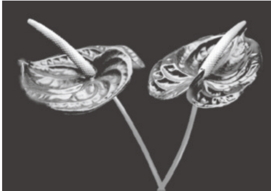
Bei diesem Motiv kam das Blaufilter zum Einsatz, um die Tonwerte zu verändern: Die roten Blüten der Flamingoblüten wurden durch das komplementäre Blaufilter erheblich abgedunkelt, so dass eine Art „low key“ Aufnahme der Blumen möglich wurde.

blockiert wird. Besonders stark wird das Licht absorbiert, wenn das Filter eine hohe Dichte aufweist. Man könnte auch sagen: Die Farbe eines Filters entscheidet darüber, welche Lichtfarben prinzipiell gesperrt bzw. durchgelassen werden und die Dichte des Filters bestimmt, in welchem Ausmaß dies geschieht. Helle Rotfilter z.B. sperren also nicht genau so viel blaues Licht wie ein dunkles Rotfilter. Der Verlängerungsfaktor gibt daher an, wie viel mehr ein neutralgraues Motiv (Graukarte) bei neutraler Beleuchtung belichtet werden muss, um im Positiv ebenfalls neutralgrau wiedergegeben zu werden.